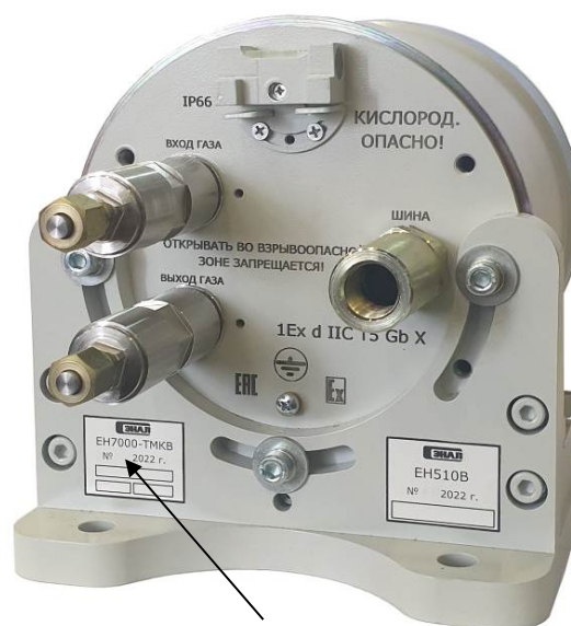
Место нанесения заводского номера