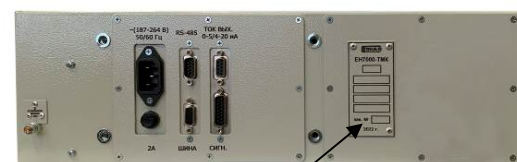
Место нанесения заводского номера