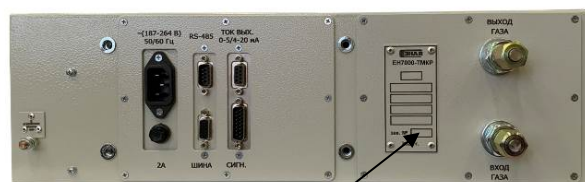
Место нанесения заводского номера