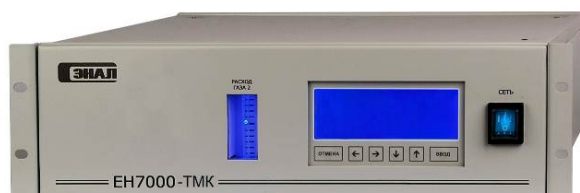
Рисунок 4 – Общий вид блока БВП-5