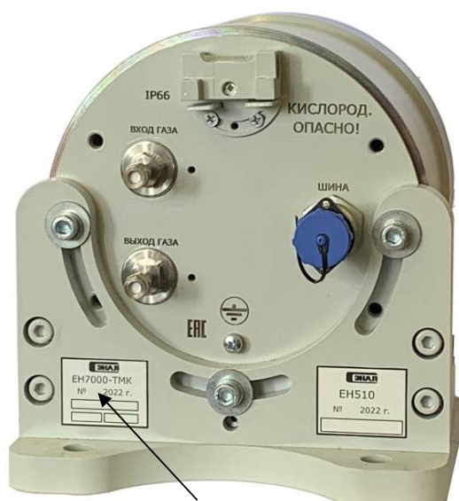
Место нанесения заводского номера

Пломбирование газоанализаторов не предусмотрено.