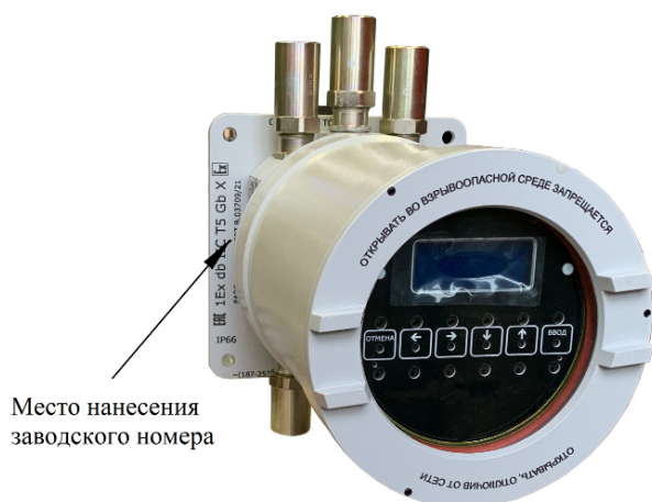
Рисунок 3 – Общий вид блока БВП-3В